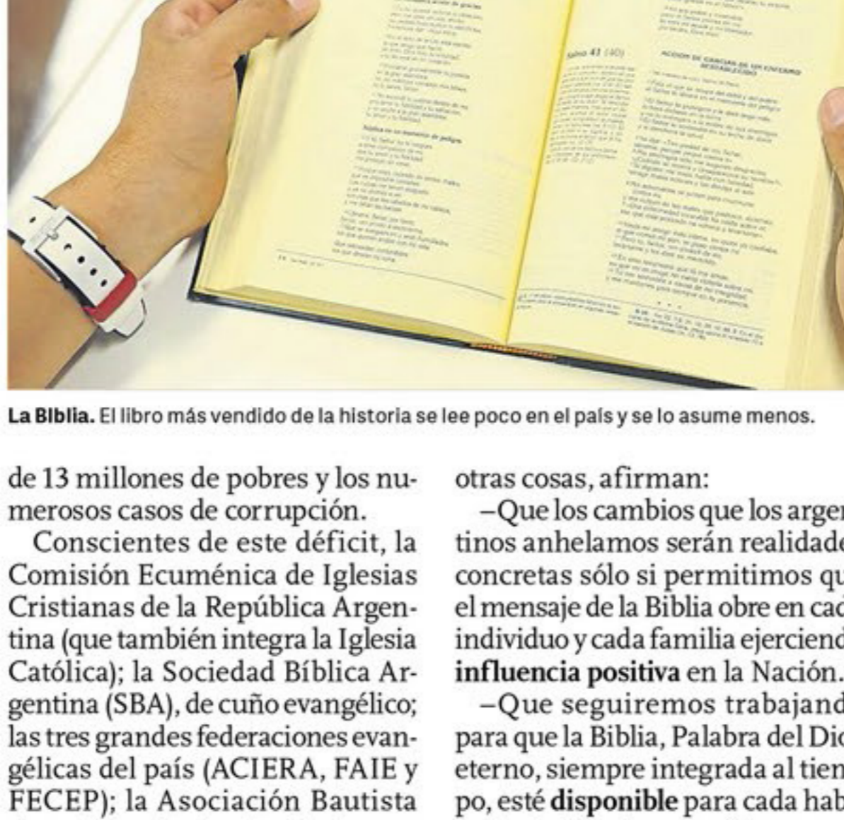
La Biblia. El libro más vendido de la historia se lee poco en el país y se lo asume menos.

Los principales cultos cristianos se comprometieron a promover en el país la lectura de la Palabra de Dios ante una realidad sombría.