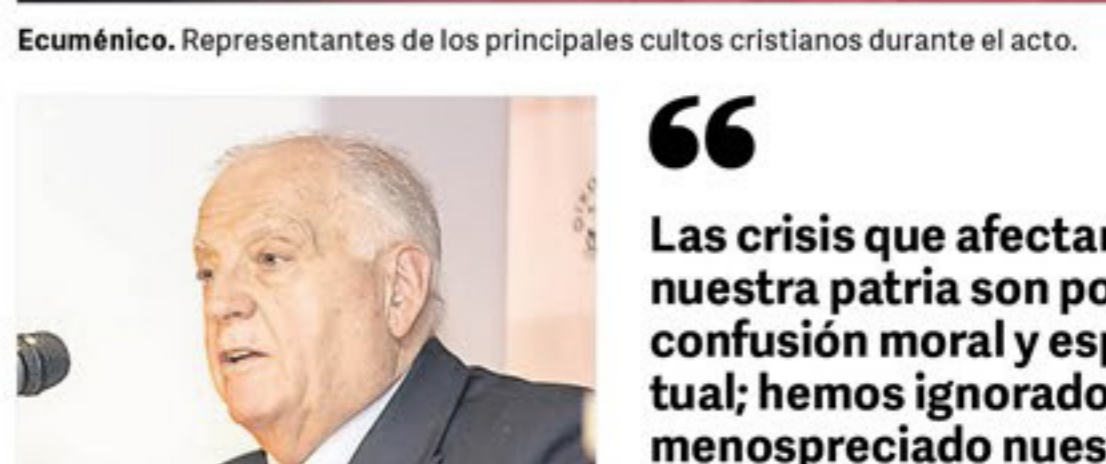
Ecuménico. Representantes de los principales cultos cristianos durante el acto.

Leer la Biblia era, en 2008, la segunda práctica religiosa de los argentinos, según la encuesta de creencias hecha ese año por el CONICET y cuatro universidades nacionales. El 42,8 % respondió que la había hecho en los últimos doce meses, detrás de "rezar en casa", que fue declarado por el 78,3 %. Es difícil evaluar este dato cuantitativamente. A primera vista, parece poco que menos de la mitad de los cristianos la haya leído durante ese año. Más difícil todavía, por no decir imposible, es que mida cualitativamente: en qué medida impactó en la conducta de los lectores. Algo es seguro: en un país donde —según la misma encuesta— los cristianos (católicos, ortodoxos, evangélicos) suman el 85 % de la población, los valores evangélicos no llegaron a ser —ni de cerca— lo suficientemente asumidos en la vida pública, a juzgar por la situación del país, visto en perspectiva histórica. Sólo dos datos actuales alcanzan para atestiguarlo: los más